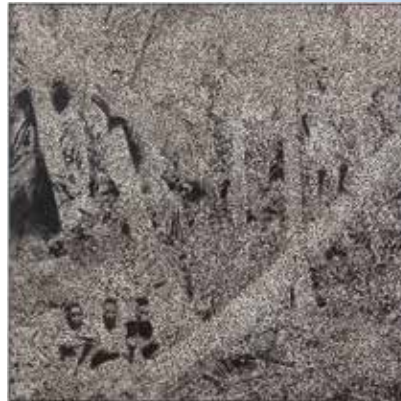
Daniel Boyd "Untitled (BINJTIV)" 2019