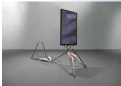
Laure Prouvost "Metal Woman-Smoking" 2015

世界の社会問題の焦点である差別やジェンダー、移民、貧困植民地主義、人種問題などのテーマに切り込む新しい表現も加えて、身体性やアクション、日常生活をキーワードに、平面作品、立体作品だけでなく映像インスタレーションなどもご紹介します。