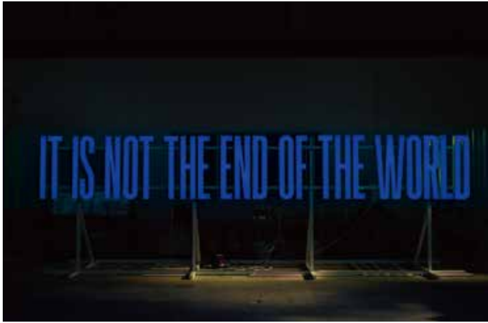
SUPERFLEX "IT IS NOT THE END OF THE WORLD" 2019

このたびは、この膨大なコレクションの中から、いま世界が目注している作家たちの作品を、下関市立美術館の展示空間に合わせてピックアップ。古来、日本列島の交通の要として「文化の交差点」となってきた場所・下関で、世界のアート・シーンの最前線の衝撃を体験する、文字どおり特別な展覧会です。