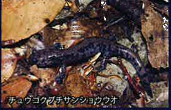
キョウゴクズチサシシヨウウオ