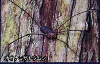
オオカミザトウムシ