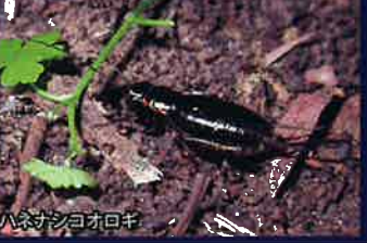
ハネサシヨウロキ