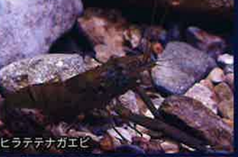
ヒラテテナガエビ