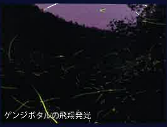
ゲンジボタルの飛翔発光

下関市豊田町は古くからホタルの発生地として知られていました。そして、豊田町を貫流する木屋川（こやがわ）はホタルの発生地として昭和32年に国の天然記念物に指定されています。下関からは9種類のホタルが確認されています。