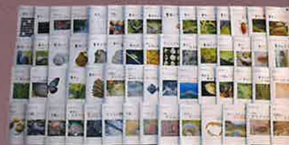
自然ガイドシリーズ

当館の調査・研究の内容の一部をまとめた「豊田ホタルの里ミュージアム 研究報告書」を毎年刊行し、販売しています。また、下関のさまざまな自然を解説したテキスト「自然ガイドシリーズ」の一部を電子書籍として販売しています。