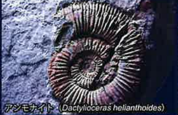
アンモナイト (Dactyloceras helianthoides)

下関は本州に位置するものの生物相は九州の特徴を合わせ持っていて、下関でもっとも高い山である華山（げさん、713m）では本州ではこの山でしか見つかからない昆虫やザトウムシなどが見つかっています。