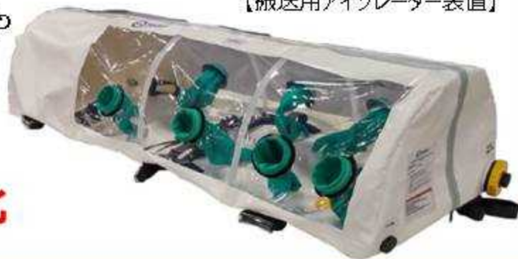
【搬送用アイソレーター装置】