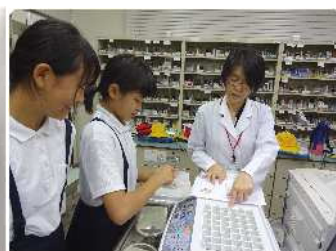
処方せん作りの体験